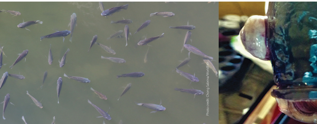
Fish lethargic at surface and not feeding

ଟିଲାପିଆ ଚାଷ ସମୟରେ ଦେଖାଯାଉଥିବା ବିଭିନ୍ନ ରୋଗ ସୟନ୍ଧୀୟ ଏହି ପ୍ରଚାର ପତ୍ର ମୁଖ୍ୟତଃ ଟିଲାପିଆ ହ୍ୟାଚେରୀ, ନର୍ସରୀ, ମାଛ ଚାଷୀ ଓ ସମ୍ପ୍ରସାରଣ କର୍ମକର୍ତ୍ତାଙ୍କ ନିମନ୍ତେ ଉଦ୍ଦିଷ୍ଟ ଅଟେ । ଯେକୌଣସି ରୋଗର ପ୍ରତିଷେଧକ ବ୍ୟବସ୍ଥା, ଆରମ୍ଭରୁ ଚିହ୍ନଟ, ରୋଗ ନିର୍ଷୟ ଓ ତୃରନ୍ତ ପଦକ୍ଷେପ ଦ୍ୱାରା ଜଳଜୀବମାନଙ୍କ ଦେହରେ ଦେଖାଯାଉଥିବା ରୋଗର ପରିଚାଳନା ଓ ନିରାକରଣ କରାଯାଇପାରିବ । ଯଦି ମାଛ ଚାଷ କ୍ଷେତ୍ରରେ ରୋଗର ପ୍ରଧାନ ଲକ୍ଷଣ ସମୂହ, ଅସ୍ୱାଭାବିକ ଆଚରଣ, ମାଛର ଅସାଧାରଣ ମୃତ୍ୟୁ ପରିଲକ୍ଷିତ ହୁଏ ତେବେ ତୁରନ୍ତ ଜଳକୃଷି ବା ମହ୍ୟ ବିଶେଷଜ୍ଜଙ୍କୁ ଯୋଗାଯୋଗ କରି ସହାୟତା ନେବାକୁ ହେବ ।