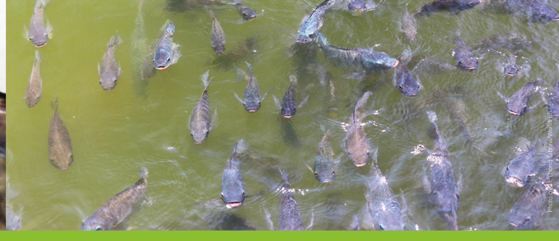
Fish gasping air at the surface