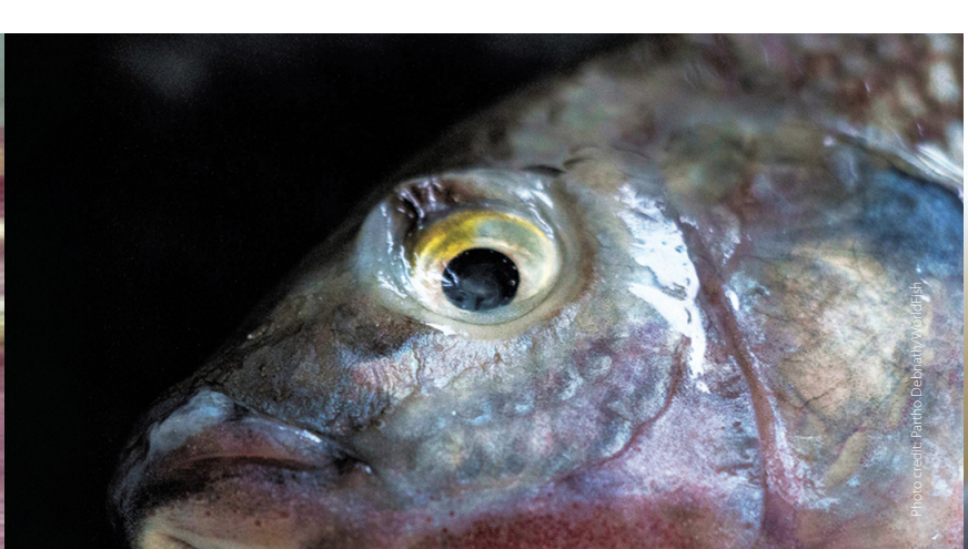
Eye endopthalmia/eye shrinkage