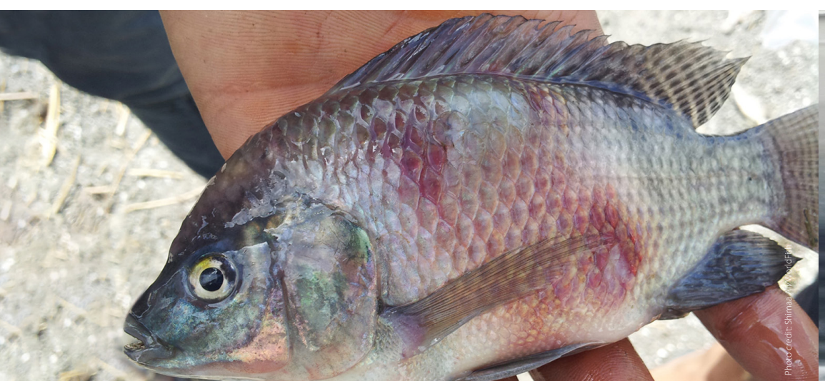
Skin erosions hemorrhagic lesion