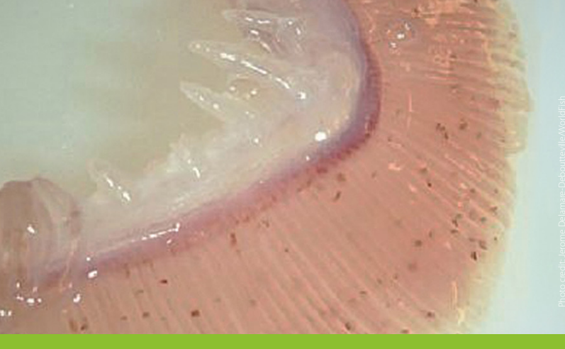
Gill paleness (anemia)