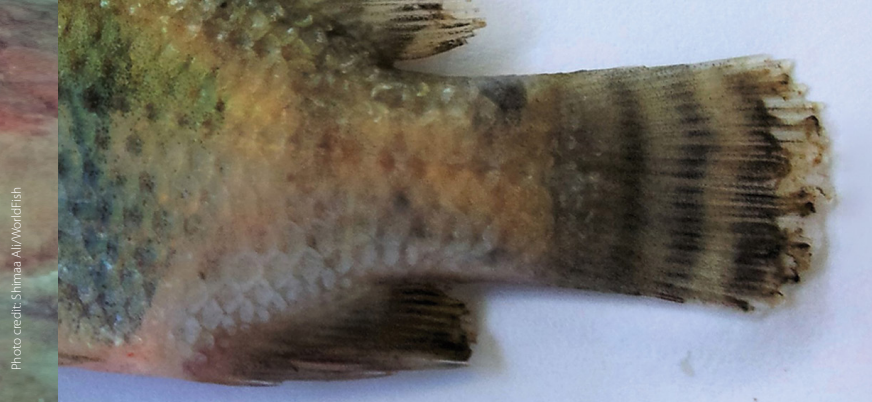
Fin rot/tail rot

ମାଛ ପକ୍ଷ ଓ ଲାଞ୍ଜରେ କ୍ଷତଯୁକ୍ତ ଘା ସୃଷ୍ଟି ଓ ଛିଣ୍ଡିବା