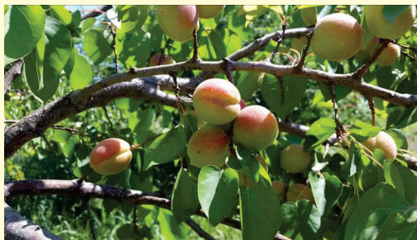
Yubileyniy Navoiy navi

pisha boshlaydi. Hosildorlik o'rtacha bir tupdan 50-60 kg. Kech bahorgi ayozlarga chidamli, kech gullaydi, qurg'oqchilikka bardoshligi yuqori darajada. Teshik dog' kasalligi bilan deyarli shikastlanmaydi.