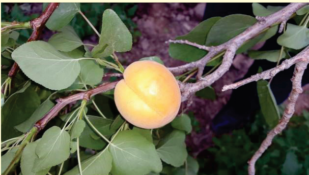
Moyli o'rik navi

Daraxt kuchli o'suvchi bo'lib, mevalari yirik yoki o'rtacha, yumaloq shaklda, vazni 30-35 g. Rangi och-sariqdan qizg'ish tusgacha bo'ladi, meva eti sariq rangda, yumshoq va sersuv. Ta'mi shirin va mazali. Hosilga 4-5 yili kiradi. Mevalari may oyining oxiri – iyun oyining boshlarida