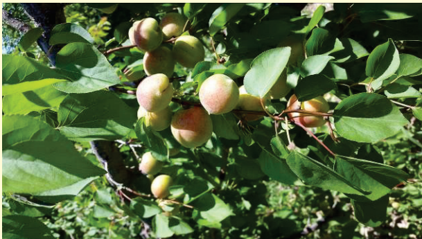
Non dovuchcha navi

hosildorlik 30-40 kg. Qurg'oqchilikka va issiqqa chidamli bo'lib, payvandtag sifatida foydalaniladi. Teshik dog' kasalligi bilan deyarli shikastlanmaydi.