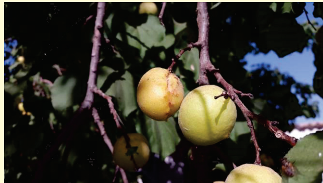
O'rikning "Hashaki" shakli

Kuchli o'suvchi daraxt, mevalari turli o'lchamlarda bo'ladi, asosan mayda, yumaloq-cho'zinchoq shaklda, vazni 20-35 g gacha yetadi. Rangi och-sariq rangda, ba'zan sarg'ish rangli, eti oqish-sariq, qattiq va o'rtacha sersuv. To'liq pishgandagina shirin ta'mli bo'ladi. Hosilga 3-5 yili kirib, may oyining ikkinchi yarmidan pishishni boshlaydi, to'liq pishish davri iyun oyining o'rtalariga to'g'ri keladi. O'rikning ushbu shakllari payvandtag sifatida juda qulay bo'lib, ko'pgina mahalliy navlar ushbu payvandtaglarga ulanadi hamda ular uzoq muddat hosil beradi. Ushbu o'rikning shakli atrof-muhitning turli salbiy ta'sirlariga bardoshli bo'lib, har yili hosil berishni ta'minlaydi.