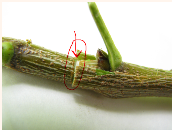
Куртакни пайвандтагга улаш

Натижада қолдирилган 1 йиллик новдалар пайвандлаш муддатида пайванд талабларига жавоб беради. Пайвандлаш 15 июндан 15