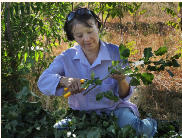
Хандон писта қаламчаларини тайёрлаш