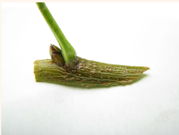
Хандон пистанинг пайванд қилинадиган куртаги

Пайвандлаш 2-3 ёшли ниҳолларда асосий танасининг илдиз бўғзи 1 смдан кам