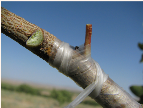
Пайвандланган хандон писта

Баъзи ҳолларда пайванд қилинган куртак шу йилнинг ўзидаёқ ўсиб кетади. Бундай ҳолда