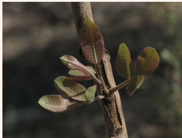
Пайванддан ўсиб чиққан новда

Пайвандланган куртаклар асосан келгуси йил баҳорда ёппасига ўса бошлайди. Бундай ҳолатда, пайвандланган куртакни яхши ўсишини таъминлаш мақсадида пайванд қилинган жойдан пастки барча новдалар олиб ташланади, пайвандтағни ўзи эса юқоридан 20-25 см қолдириб кесиб ташланади.