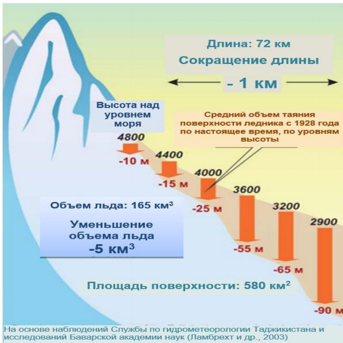
Рисунок 3. Таяние ледника Федченко

15. Скорость ветра стало сильнее за эти годы. Скорость ветра равная или превышающая 15 миль в секунду наблюдаются на метеорологических станциях в узких горных долинах (например, Худжанд и Файзабад), в горных перевалах (например, Анзобский перевал), а также на высокогорном плато (например, Восточный Памир). Количество дней с западными ветрами уменьшились, в результате меньшего вторжения холодного западного воздуха, но количество дней с восточными и северо-восточными ветрами увеличились.