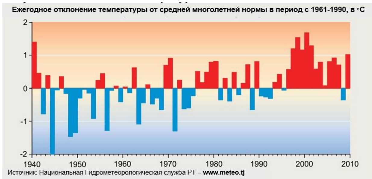
Рисунок 1. Изменение температуры в Таджикистане

12. Наблюдаемые изменения в длительности безморозного сезона, определяется как число безморозных дней (дни, превышающие 0.2^{\circ}\text{C} ) в течение года, отражают увеличение численности сезонных температур. Безморозные дни отражают тенденции потепления зимних температур. Каждый год было на 5-10 безморозных дней больше. Дни, когда средние температуры регистрируются выше нуля, теперь приходятся на раннюю весну и позднюю осень.