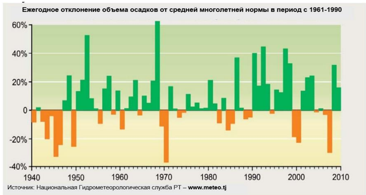
Рисунок 2. Изменения осадков в Таджикистане

14. Продолжающееся таяние и отступление ледников, связанные с изменением климата, вызывает озабоченность для Таджикистана, так как ледники и снежные запасы Таджикистана являются основными источниками ирригационной воды. Примерно 30% ледникового покрова утрачено с 1930 года; текущая скорость таяния составляет потери в годовом измерении 0,5%-0,8%. Самый большой ледник в Таджикистане Ледник Федченко, отступил на расстояние в 1 км, и потерял около 5 км льда с начала XX века (рисунок 3). Небольшие ледники в низовьях получают наибольшее влияние от изменения климата и тают с беспрецедентными темпами. Например, в Дяхандаре, ледник с площадью поверхности менее 1 км 2 , расположенный в верховье реки Каратаг, полностью растаял. Размер Зеравшанского ледника уменьшился на 10% в период между 1927- 2010 гг., и отступил на 2,5 км.