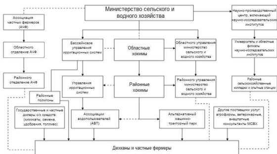
Сельскохозяйственные консультационные услуги в Узбекистане.

Министерство сельского и водного хозяйства (МСВХ) является ответственной организацией за координацию всех сельскохозяйственных мероприятий, включая консультационные услуги для фермеров в Узбекистане.